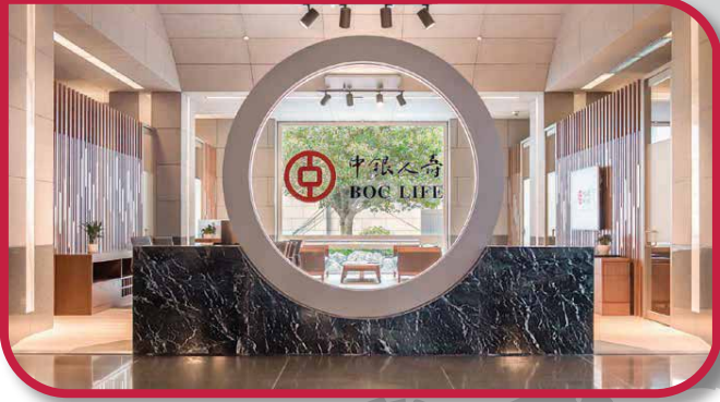
中环花园道1号中银大厦1楼东厅