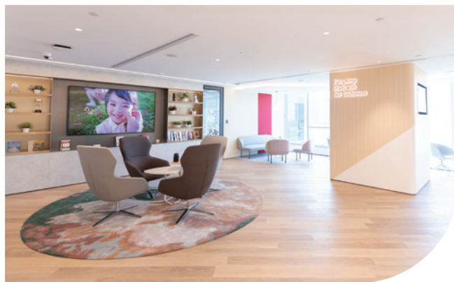
尖沙咀港威大廈5座11樓