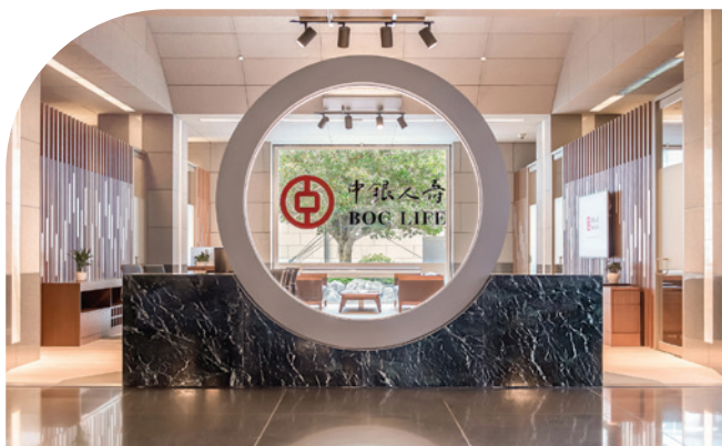
中環花園道1號中銀大廈1樓東廳